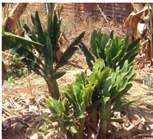
Feuilles étroites et dressées en "bouquet", sur pieds très malades