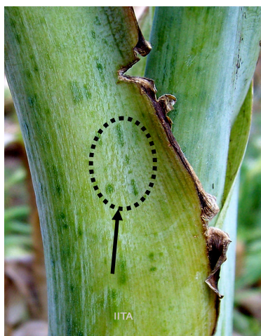
Points et traits vert foncé sur pétiole