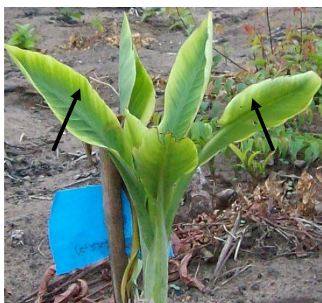
Les bords des feuilles sont jaunes ou décolorés

La maladie du Bunchy top est due au virus BBTV (Banana bunchy top virus). Les pieds infectés à un stade tardif peuvent ne pas présenter les symptômes typiques du "bouquet". Mais leurs rejets présentent des symptômes caractéristiques : jaunissement du bord des feuilles et stries vert foncé sur feuilles et pseudotrunc.