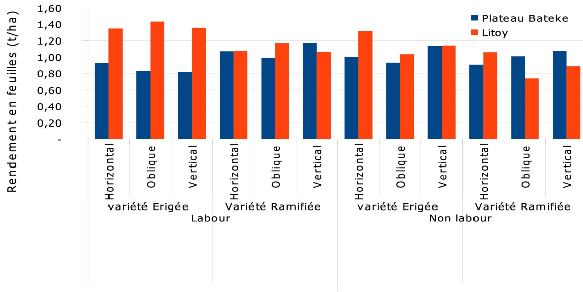
Figure 2: Rendement en feuilles obtenus dans les 2 sites (Lito et Plateau de Batéké) suivant la préparation du sol, le mode de plantation des boutures et les variétés de manioc.